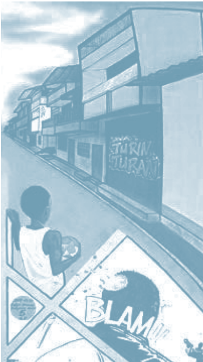
*Galería de la resistencia de Buenaventura (fragmento)